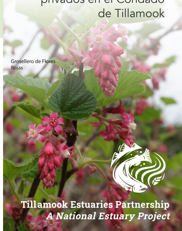
Grosellero de Flores Rojas

Un programa gratuito y voluntario de asistencia para propietarios privados en el Condado de Tillamook